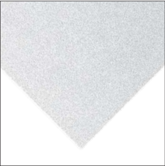
▲ Feria Unperforated